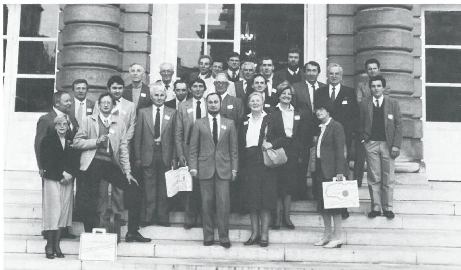
Avril 85 - Présentation du C.E.B au Sénat par 150 élèves et chefs d'entreprises

Mais les résultats acquis, nous les devons également aux appuis importants que nous avons obtenus tant au niveau départemental, régional que national et particulièrement auprès de M. Raymond Marcellin, ancien ministre, ancien président du Conseil Régional de Bretagne, député et président du Conseil Général du Morbihan qui nous a tou-