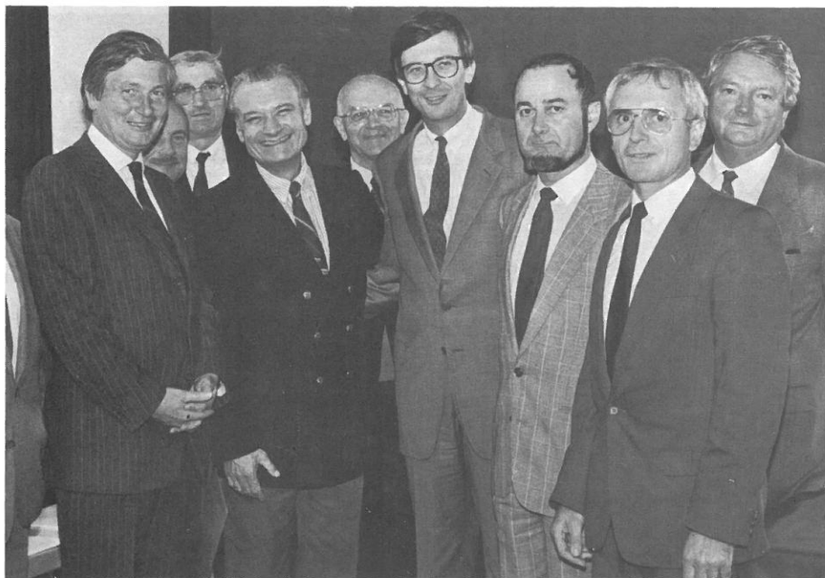
Visite de Monsieur Bernard BOSSON, ministre délégué aux affaires européennes - Ménéac (sept 1986)